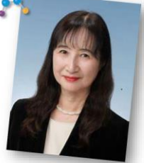
国立研究開発法人 科学技術振興機構 副理事/ダイバーシティ推進室長

申込方法 電話・HP、または裏面に必要事項をご記入の上、FAX・郵送・直接来店にてお申込みください。