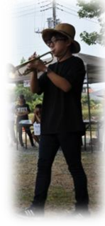
8月『なすしおばら市民フェスタ2018』