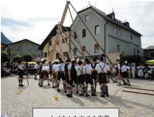
マイバウムを立てる作業

しかし、一度立てられた木は、夜になると隣町の若者団体に盗まれてしまう可能性があります。そのため一晩中マイバウムを見守るのですが、もし盗まれてしまった場合は、犯人たちに食事を奢ることで取り戻すことができます。地域によって「木盗み」のルールは多少異なりますが、オーストリア全土にこのような習慣が存在しています。