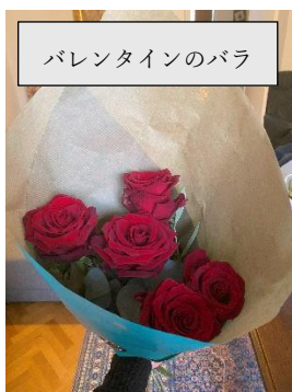
バレンタインのバラ

皆さん、バレンタインデーとホワイトデーに、お菓子を贈ったりもらったりしましたか？日本では2月14日に女性から男性へチョコレートを贈る習慣がありますが、最近では「友チョコ」や感謝を伝える「義理チョコ」など、目的や楽しみ方も多様化しているようですね。