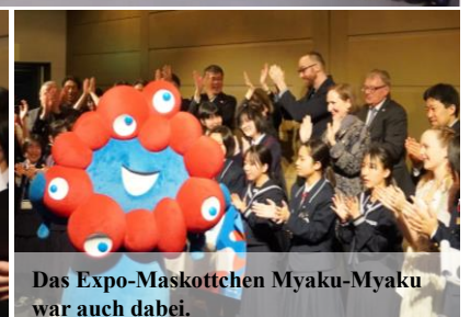
Das Expo-Maskottchen Myaku-Myaku war auch dabei.