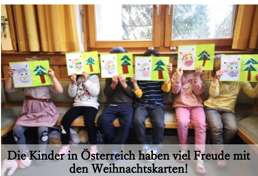
Die Kinder in Österreich haben viel Freude mit den Weihnachtskarten!

Zu Jahresende kam ein Briefaustausch zwischen dem Kindergarten von Nishi-Nasuno und der Kreuzschwestern Linz erfolgreich zustande! Neben selbst gestalteten Weihnachtskarten war in dem Paket aus Japan noch ein Fotoalbum voll mit Bildern vom Alltag und von besonderen Ereignissen im Nishi-Nasuno-Kid's House. Die Post aus Österreich ist schon am Weg nach Japan und die Kinder in Nishi-Nasuno können es kaum erwarten, die Fotos vom Kindergarten der Kreuzschwestern Linz zu sehen!