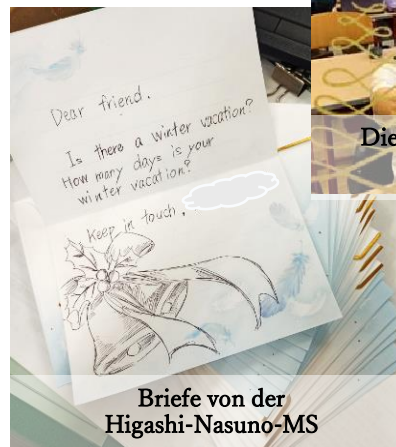
Briefe von der Higashi-Nasuno-MS