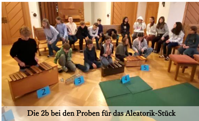
Die 2b bei den Proben für das Aleatorik-Stück

Anschließend sangen uns die SchülerInnen der Higashi-Nasuno-MS verkleidet als Weihnachtsmänner „Jingle Bells“ vor. Von Seiten der KSL kam eine interessante Experiment-Aufführung: Mithilfe von Würfeln, stellte uns die Klasse das Prinzip der Zufallskomposition (Aleatorik) vor. Durch einmal würfeln wird entschieden, wer zu welchem Instrument geht, beim zweiten Mal würfeln, weiß man durch die Augenzahl, wie oft man den vorbestimmten Takt beim Instrument wiederholt. Nicht nur die SchülerInnen, sondern auch die japanischen Lehrkräfte waren beeindruckt von der schönen Aufführung nach dem interessanten Prinzip!