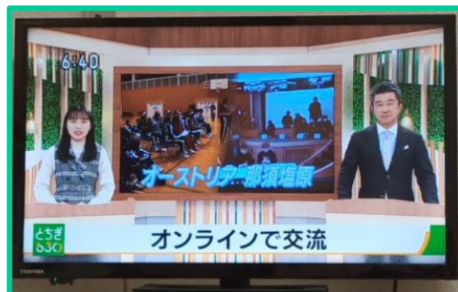
Wir waren in den japanischen Nachrichten!

Hier könnt ihr euch mehr Fotos vom Austausch ansehen!