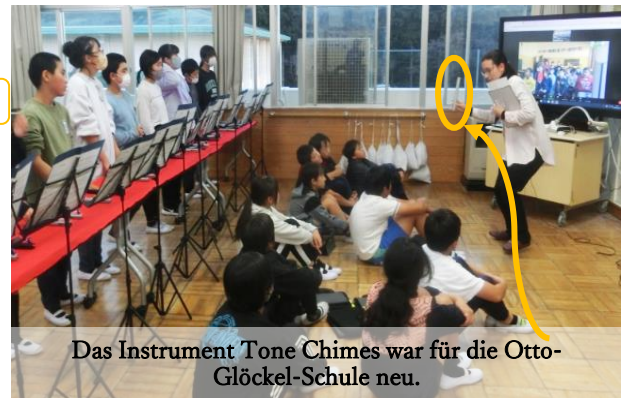
Das Instrument Tone Chimes war für die Otto-Glöckel-Schule neu.

Nachdem sich die Kinder ihre Schulen gegenseitig vorgestellt haben, sang uns die Nishi-VS ihr Schullied vor und präsentierte uns ein Stück mit „Tone Chimes“ – gestimmte Metallstäbe, die man wie Handglocken in der Hand hält und die einen Metallofon-ähnlichen weichen Klang erzeugen. Folgend sang die Otto-Glöckel-Schule zwei besondere Lieder: ein teilweises afrikanisches Begrüßungslied und das Lied „Anders als du“. Die zwei Lieder sollen die internationale Gemeinschaft der Klasse darstellen, auf die die 3. Klasse besonders stolz ist. Bei der anschließenden Fragerunde haben wir viel Neues gelernt! Dass es in Österreich kein Baseball gibt oder eine Schulklasse so international sein kann, war für die japanischen Kinder neu. Dafür haben die österreichischen Kinder das Instrument „Tone Chimes“ kennengelernt sowie ein neues Handzeichen: wenn man mit beiden Armen einen Kreis über dem Kopf bildet ☹️, bedeutet das „Ja“ oder „Ok“. Im Gegenzug zeigte die Otto-Glöckel-Schule der Nishi-VS, wie man in der Gebärdensprache klatscht!