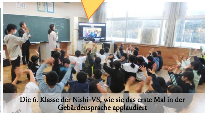
Die 6. Klasse der Nishi-VS, wie sie das erste Mal in der Gebärdensprache applaudiert