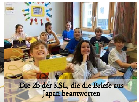
Die 2b der KSL, die die Briefe aus Japan beantworteten