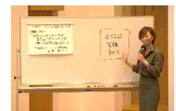
女性リーダーについての講座

とちぎウーマン応援塾を人生100年時代を有意義に過ごすために受講をしました。対面、オンライン講座内容も充実しており、学ぶ楽しさを体験しました。今後も社会参加等に励みます。