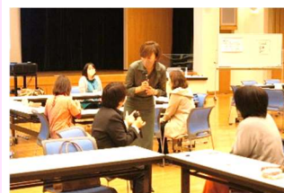
講師から質問を受ける受講者

毎回、プラスになるお話ばかりで、とても参考になりました。この様な学べる機会を与えていただきまして感謝いたします。