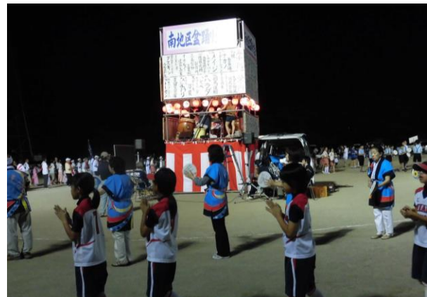
過去に開催した盆踊り大会の様子