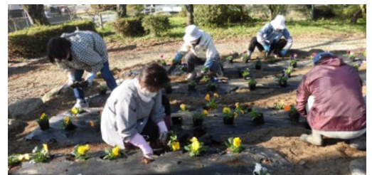
昨年度の作業風景