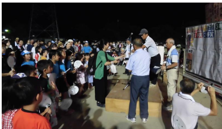
▲お楽しみ大抽選会。参加賞のうちわの番号で抽選をしました。私の番号、当たってるかな？