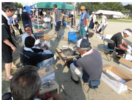
▲焼き鳥模擬店の舞台裏・・・暑期中、汗をかきながら本格炭火で焼き上げています。