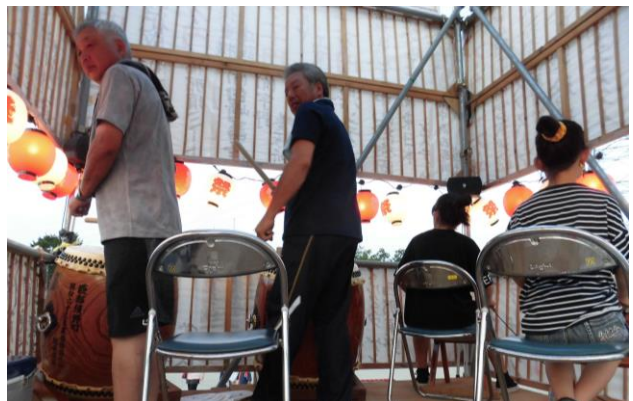
▲今年も熱のこもった太鼓の演奏、お疲れさまでした！

御参加いただいた皆さん、御来賓の皆様、また、早朝の準備から当日の運営、更には翌日の後片付けまで、猛暑の中御協力をいただいた実行委員の皆さんに心から感謝を申し上げます。