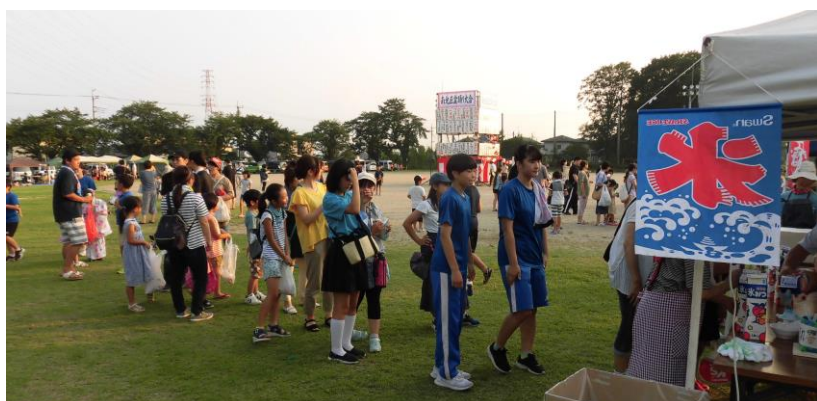
▲大人気のかき氷の模擬店には長蛇の列。今年も無料で提供されました。