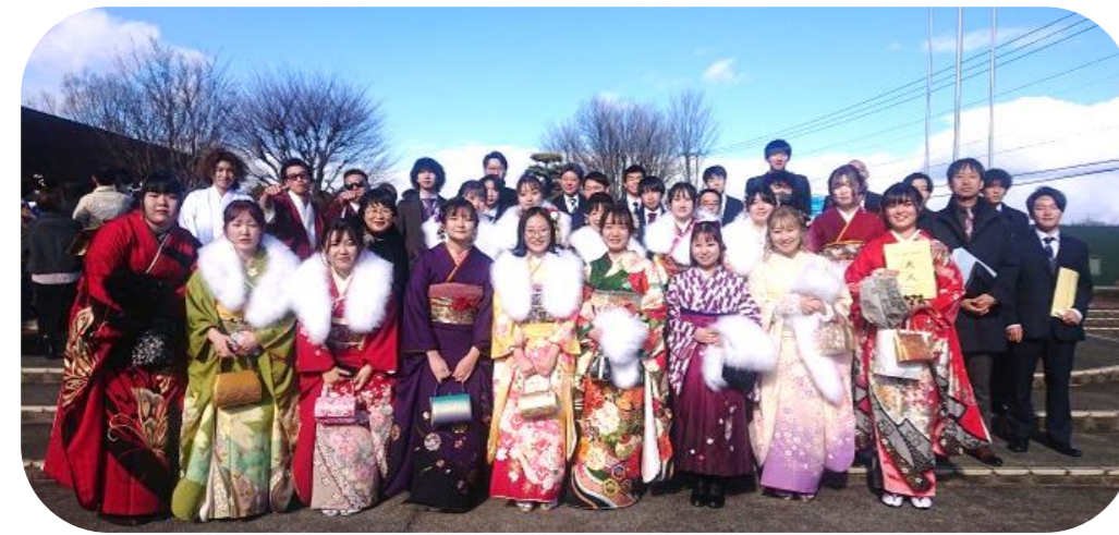
とき：令和6(2024)年1月7日(日) 会場：大正堂くろいそみるひいホール