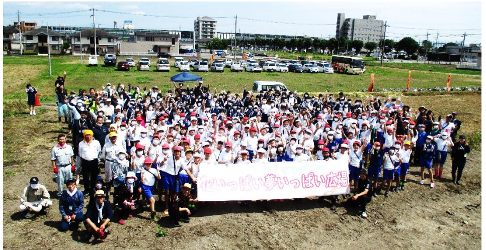
地域の小・中学生と団体のみなさん、約270人で記念撮影

花畑のネーミングを、地域の小・中学生に募集した結果、波立小学校6年生の作品が採用されました。名称は「花いっぱい夢いっぱい広場」です。