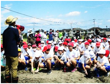
種のまき方の説明を聞いてから ↓↓↓ 小・中学生に分かれて作業開始!