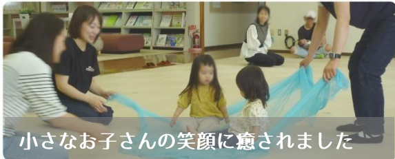
小さなお子さんの笑顔に癒されました

乳幼児と保護者を対象とした「ちびっこ教室」を行いました。前期は6月と7月、後期は9月と10月で、大人気のリトミック遊びのほか、読み聞かせやベビーマッサージ教室なども行いました。