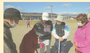
しっかりスコアチェック☆