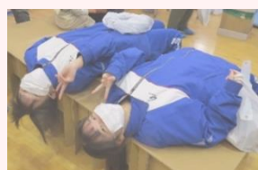
段ボールベッドの強度は？

12月7日(日)にいなむらコミュニティ主催の「防災のつどい」が公民館を会場に行われ、市危機対策課や消防署の話を聞き、段ボールベッド体験や煙体験、土のう作りを行いました。