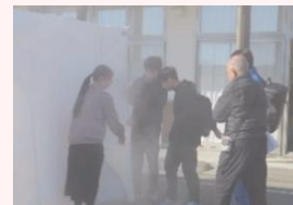
煙体験コーナーも