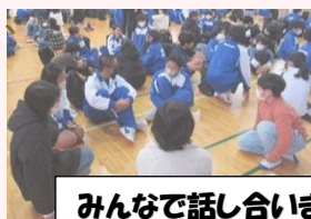
みんなで話し合いました

「災害への備え」をテーマに那須赤十字病院の方の講話を聞いたり小中学生と地域の方が一緒にグループを作り防災についての意見交換をしました。