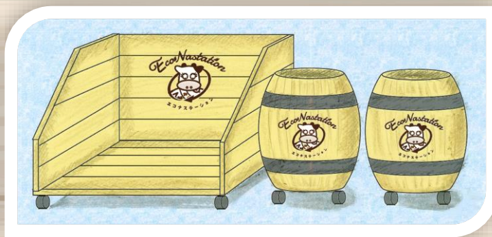
回収スペースのイメージ

（注）EcoNaStation：Eco（エコな）Na（那須塩原市の）Station（回収拠点）