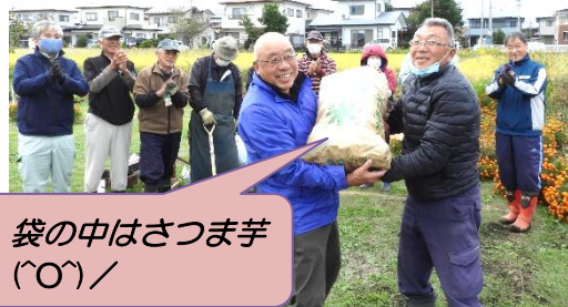
袋の中はさつま芋(〇)／