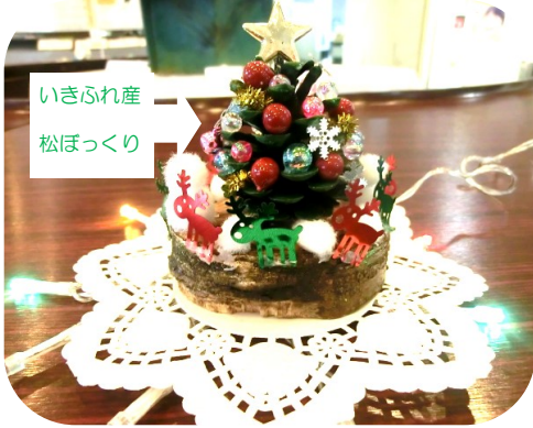
いきふれ産 松ぼっくり

12月3日に予定していた第6回「クリスマスの小物作り」は、新型コロナウイルスの感染状況を考慮し、作り方の説明のみを行い、材料を配布し家庭で製作することとしました。出来上がりが楽しみです。