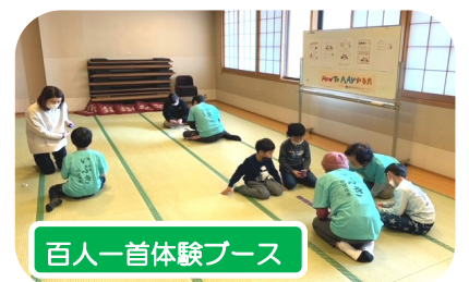
百人一首体験ブース