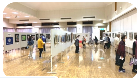
作品展示・団体紹介