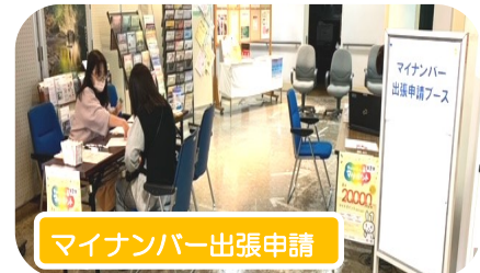
マイナンバー出張申請