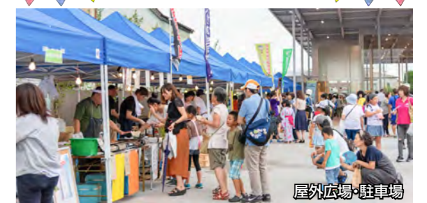
屋外広場・駐車場

屋外広場は、駐車場と一体で借りられ、大小さまざまな催しに利用できます。イベント用の電源やシンク(給排水設備)を完備し、テントやテーブル、イスなどの各種備品も貸し出しています。 ▶使用料 10㎡につき4時間500円 ※営利目的時のみ有料。備品は無料で利用可。 ▶その他 新型コロナウイルス感染症対策のため、一部利用を制限しています ▶問い合わせ まちなか交流センター「くるる」 ☎0287(73)5597