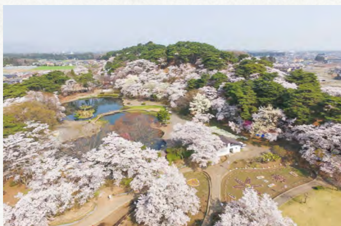
満開の桜が咲き誇る烏ヶ森の丘