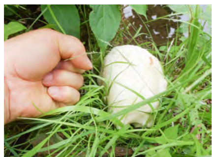
モリアオガエルの卵塊 撮影日：2016.7.4 撮影場所： 市クリーンセンター