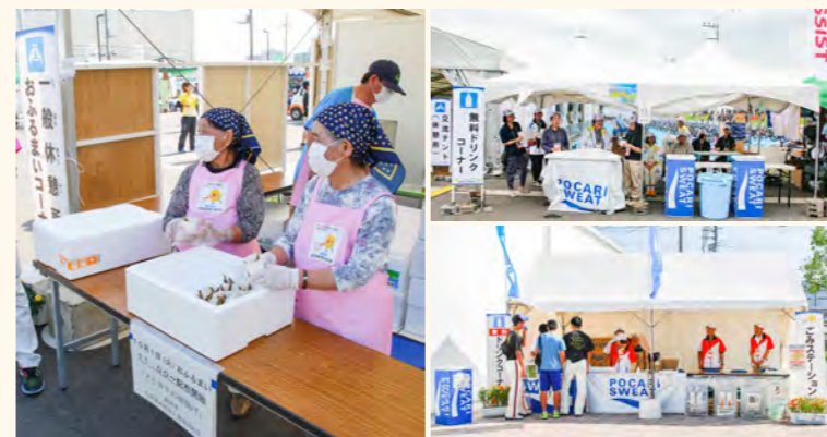
過去大会でのボランティアのようす