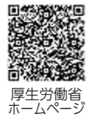
厚生労働省ホームページ

新型コロナウイルス感染症の感染者と接触した可能性がある場合に、通知を受け取ることができるスマートフォンのアプリです。Bluetooth(近接通信機能)を利用して、ほかのスマートフォンとおおむね1メートル以内で15分以上近接していた場合、「接触」として検知し、「接触」情報を自分のスマートフォンにのみ記録します。