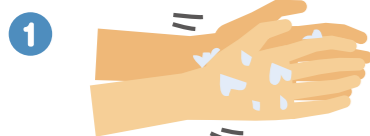
1 流水でよく手をぬらした後、石けんをつけ、手のひらをよくこすります。