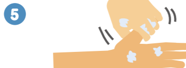
5 親指と手のひらをねじり洗います。