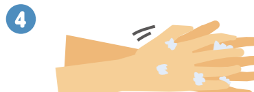
4 指の間を洗います。