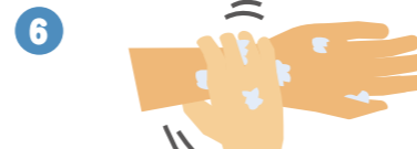
6 手首も忘れずに洗います。

石けんで洗い終わったら、十分に水で流し、清潔なタオルやペーパータオルでよく拭き取って乾かします。