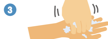
3 指先・爪の間を念入りにこすります。