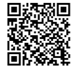
市民大学 ホームページ

○厚生生涯学習課 ☎(37)5364 shougai@city.nasushiobara.lg.jp