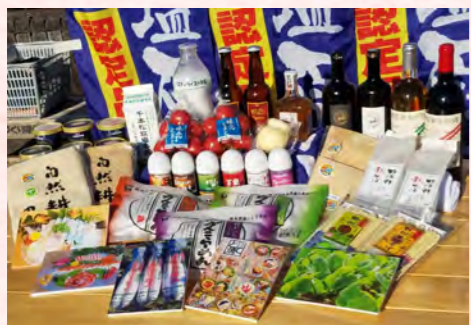
おいしい食べ物が手軽に食べられる恵まれた環境

景観の重要性に気付かされたところなんです。有識者会議での市外から見た意見と、今後予定している市民を交えた検討会における意見を融合させ、より良いビジョンを策定していきます。那須塩原駅周辺がどんな風に生まれ変わるのか期待していただくのはもちろん、このまちの明るい未来にワクワクドキドキしてください。