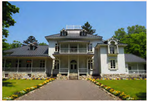
日本遺産に認定されたこのまちの歴史

こんなにも恵まれた環境があり、高いポテンシャルを秘めていることは私自身も肌で感じていますし、市外の人から絶賛の