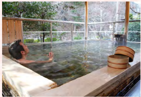
気軽に楽しめる良質な温泉