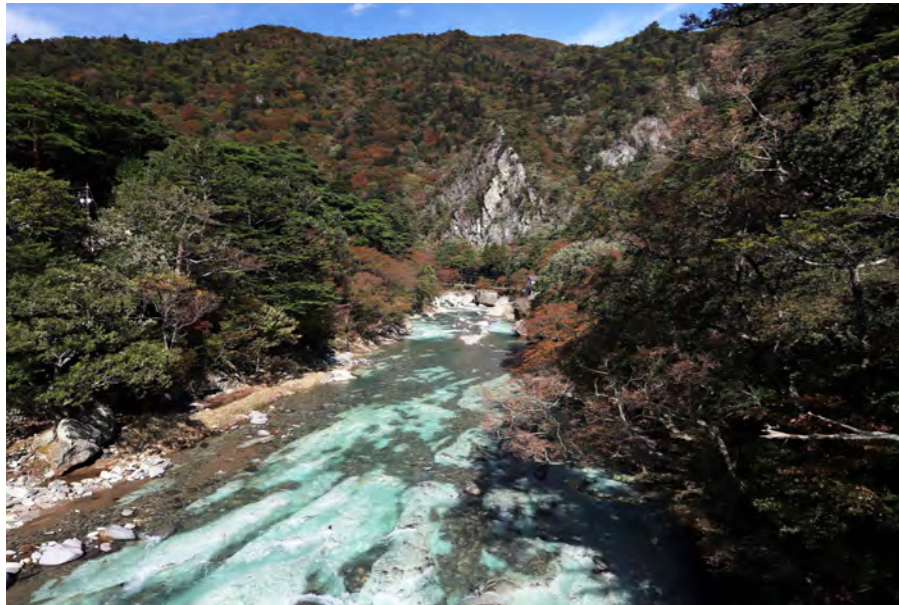
青く澄んだ箒川 撮影日:2019.10.20 撮影場所:塩原福渡