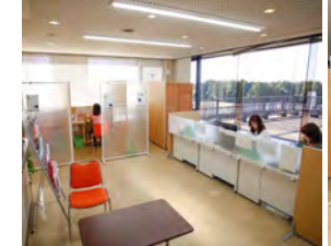
↑個人ブースなのでプライバシーも守られて安心です。

結婚相談員が常駐し、入会受付や相談に応じます。とちぎ結婚支援センター全体では、男性1,360人、女性826人が会員登録しており、これまでに55組が結婚、1,323組が交際に至っています。