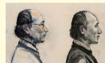
舟越桂(那須野が原博物館蔵)