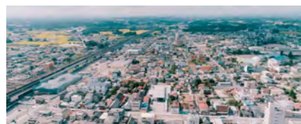
『ホットミルクロード』水口 紋蔵 監督

ある日、5年3組の金魚がいなくなる。いじめられっ子の少年が疑われる中、理科室で出くわしたもう一人の少年と心を通わせるようになり…。