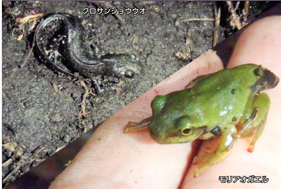
クロサンショウウオ