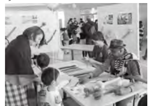
ALT English Festival