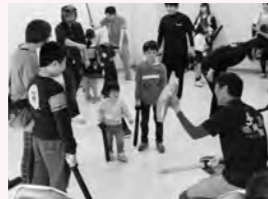
スポーツチャンバラ体験