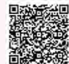
申し込みはコチラ