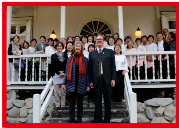
オーストリア交流合唱団公演 東京オリ・パラに向けて結成された合唱団。フェスタではドイツ語の歌も披露します。