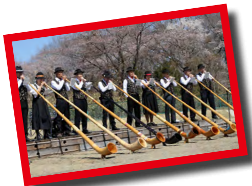
那須アルプホルンクラブ公演 手作りのホルンでの演奏は圧巻。会場ではアルプホルンの体験もできます。