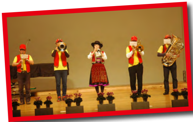
那須ハンブリーアンサンブル公演 オーストリア・チロル地方の音楽を中心に、聴いて、見て、楽しい演奏をお届けします。