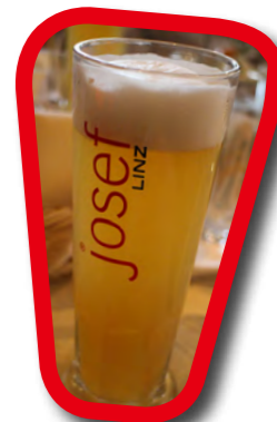
オーストリアビール チェコやドイツに負けにくいくらい飲まれているビール。ソーセージやグラーシュとの相性も抜群。