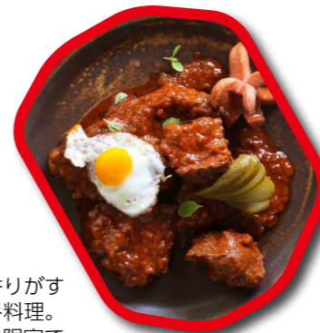
グラーシュ 食欲をそそる香りがする牛肉の煮込み料理。当日は、150食限定で無料配布します！