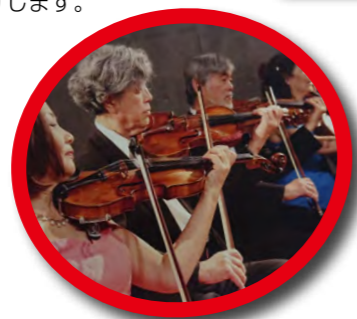
カリス弦楽四重奏団公演 ウィーンで経験を積んだプロの弦楽四重奏団。本場の音楽はもちろん、幅広いレパートリーで楽しませてくれます。