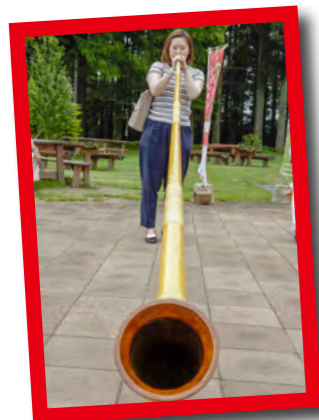
アルプホルン体験

アルプホルンの演奏体験ができる貴重な機会があるほか、民族衣装体験コーナーでおしゃれな民族衣装を着れば、インスタ映え間違いなし！