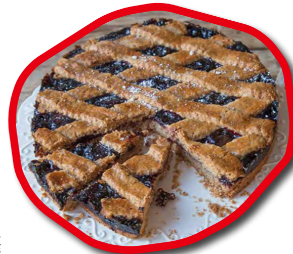
リンツァートルテ 「リンツのケーキ」という意味があるリンツ市の名物。ナッツをたくさん使った生地とジャムが特徴です。