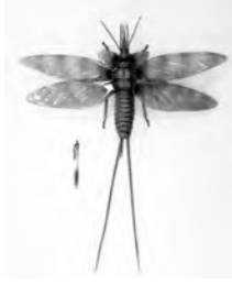
ムカシアミバネムシ 復元模型

昆虫はいつ誕生して、どのようにしてさまざまなグループに分かれたのか。那須塩原市をはじめ世界各地から発掘された化石標本をもとに、4億年にわたる繁栄のシナリオに迫ります。