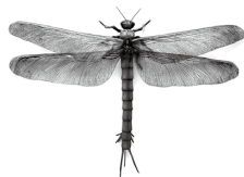
メガネウラ復元模型