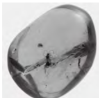
虫の閉じ込められた琥珀

昆虫はいつ誕生して、どのようにしてさまざまなグループに分かれたのか。那須塩原市をはじめ世界各地から発掘された化石標本をもとに、4億年にわたる繁栄のシナリオに迫ります。