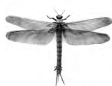
メガネウラ復元模型