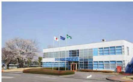
東レ株式会社那須工場 (井口1190-13) 【業種】製造業 【業務の内容】バッテリーセパレータフィルムの製造 【問い合わせ】☎0287(39)1200

東レで作っている製品は、最終製品の中に組み込まれる一部の材料であることが多く、なかなか表に出る機会はありません。しかし、なくてはならないものであること。それが東レの強みであると自負しています。いつか自分の設計した製品が商品となった時には、「自分はこの商品とすごい製品をつくられているんだよ」と子どもにも伝えられるように、これからも日々努力していきたいと思っています。