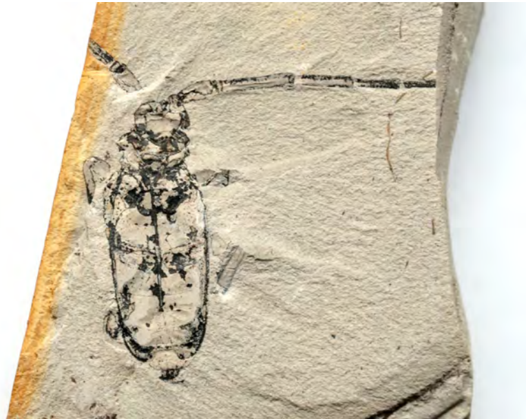
ゴマダラカミキリの化石(木の葉化石園蔵) 産出場所:中塩原