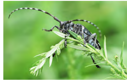
ゴマダラカミキリ 撮影場所: 金沢

体長3cm前後のカミキリムシ。黒地に白いまだら模様の特徴。森林や公園、市街地などに広く分布する。幼虫は、ヤナギやクリなどの生きている木にもぐって材を食べて育つ。