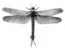
メガネウラ復元模型

昆虫はいつ誕生して、どのようにしてさまざまなグループに分かれたのか。那須塩原市をはじめ世界各地から発掘された化石標本をもとに、4億年にわたる繁栄のシナリオに迫ります。