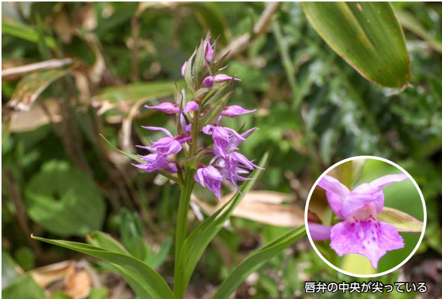
唇弁の中央が尖っている