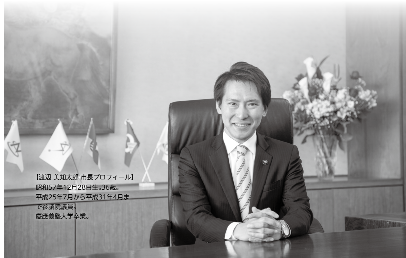
【渡辺 美知太郎 市長プロフィール】 昭和57年12月28日生。36歳。 平成25年7月から平成31年4月まで参議院議員。 慶應義塾大学卒業。