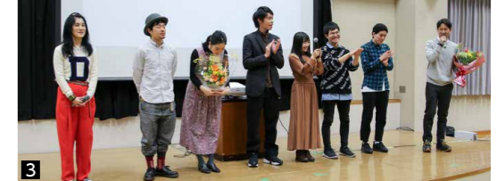
1 パネルディスカッションでは、障害者アートや映画など、多角的な視点からアートの可能性が議論された。2 旧戸田小学校のピアノをモチーフに撮影された「HARMONY」を完成記念として上映。3 上映後、出演者が登壇すると会場からは大きな拍手が。