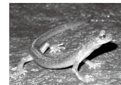
ハコネサンショウウオ

カエルやサンショウウオが 栃木県に何種類いるか知っ ていますか? カエルたちの特徴や生息環 境などについて分かりやす く解説します。