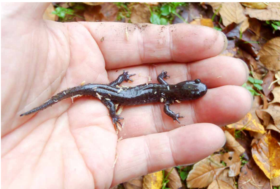
大人になる前のクロサンショウウオ 撮影日:2018.10.10 撮影場所:大沼周辺