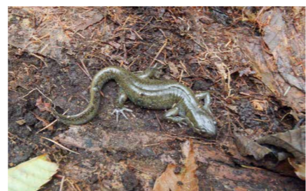
体長15cmのクロサンショウウオ

日本固有のサンショウウオです。東北地方から、中部地方北部にかけての本州と佐渡に生息しています。4～5月にかけて、卵形状の卵嚢を水中の枯れ枝などに産みつけます。市内には、大規模な産卵場所があることで有名ですが、環境悪化などにより、上陸する個体数の減少が危惧される現状にあります。国・県・市で準絶滅危惧種に指定されています。