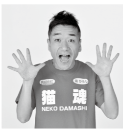
【大会ゲスト】猫ひろしさん 芸能界きっての健脚芸人。 2016年リオデジャネイロ五輪男子マラソン カンボジア代表

新緑の季節の幕開けに塩原温泉街を走り抜け、心地よい汗を流してみませんか。沿道の声援や走った後の温泉入浴サービスが嬉しい大会です。大会ゲストに猫ひろしさんを招きます。