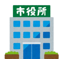
市役所で登録申請 持ち物：印鑑