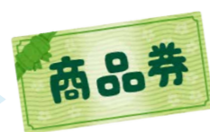
商品券と交換 10ポイントにつき、1,000円相当の商品券と交換

高齢者が住み慣れた地域で健やかにいきいきと暮らしていくためには、日頃から健康づくりや介護予防を心掛けることが大切。市では、ボランティア活動を通して介護を予防する取り組みを進めています。