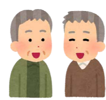
ボランティア活動 内容は下の「よくある質問」を確認してください。