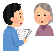
受入施設と調整 自分に合った活動・施設を選びます