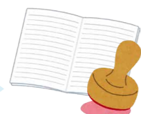
スタンプが貯まる 1回1時間の活動で1スタンプ。スタンプ数に応じたポイントを付与します。