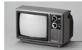
イメージキャラクター 家電殿下