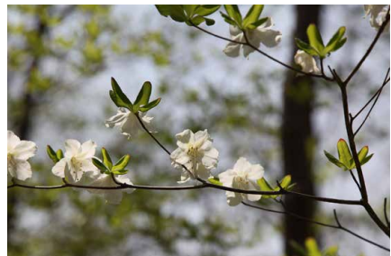
5月に咲くゴユウツツジ

カバノキ科カバノキ属 Betula davurica 樹皮がぼろぼろで、幾重にもはがれる ことから八重皮という名がついた。