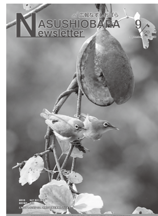
平成30年9月20日号 撮影者 稲沢敏夫(東原) 撮影場所 東原