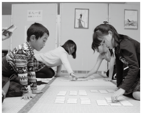
ほか 百人一首体験