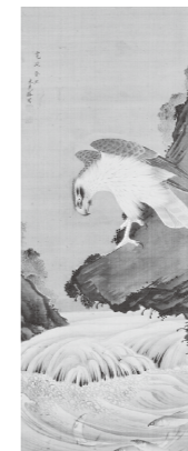
高久靄厓 《鷹に鮎図》