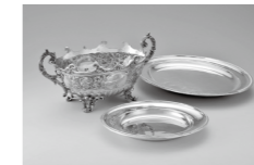
松方家で使用された銀製洋食器

那須野が原の開拓に大きな影響を与えた華族農場と、華族たちの別邸での生活について、調度品や古写真など、ゆかりの品々から紹介します。併せて、牛乳生産やぶどう栽培など那須野が原における西洋の導入にも注目します。