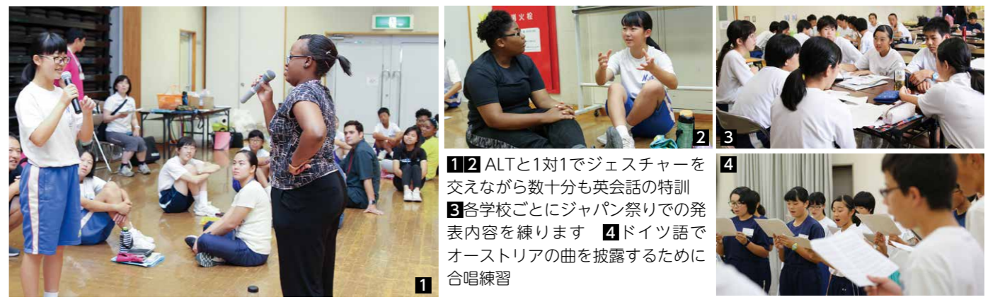
1 ALTと1対1でジェスチャーを交えながら数十分も英会話の特訓 2 各学校ごとにジャパン祭りでの発表内容を練習 3 ドイツ語でオーストリアの曲を披露するために合唱練習