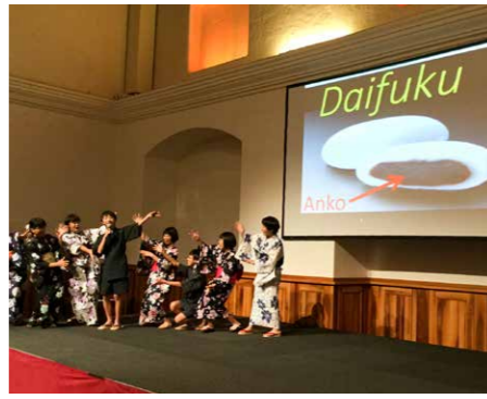
シュタイレック城で行われるジャパン祭りに参加。日本文化のプレゼンテーションをします。