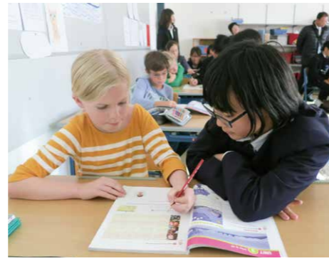
リンツ・インターナショナルスクールオウホフ校にて、授業を見学。現地の子どもたちと交流します。