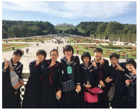
ウィーン市内のシェーンブルン宮殿や国立歌劇場を見学。歴史や風土に触れる貴重な経験です。