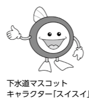
下水マスコットキャラクター「スイスイ」