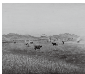
高橋由一 《鑿道八景 下野那須郡三島村平野牧牛》