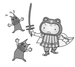
復十字シールキャン ペーンキャラクター 「シールぼうや」

結核の初期症状は、風邪とよく似ています。2週間以上続く咳や、特に高齢者で、だるさ・微熱が続く場合や、急な体重減少がある場合には、結核の可能性も心に留めて医療機関を受診し、胸部レントゲン検査を受けましょう。症状が無いときも、年に1回は職場や市の検診で胸部レントゲン検査を受けましょう。