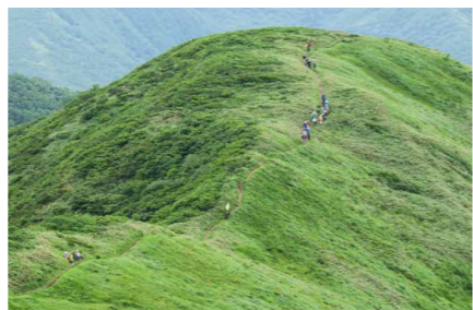
ながれいしやま 流石山から見た大峠山の頂上

キク科ウスユキソウ属 Leontopodium japonicum ヨーロッパのエーデルワイスの仲間 で、花の外側の包葉が白く、雪が積もっ たように見えることからこの名がつい た。